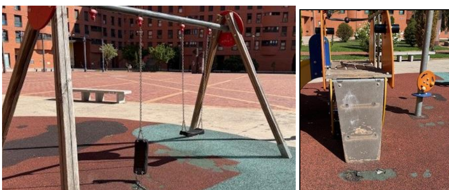
-Algunos desperfectos zona infantil Plaza del Doctor Emilio Giménez Heras-

Con el fin de comprobar directamente la situación denunciada, personal de esta Institución procedió a visitar todas las zonas de juego infantil referidas, constatando que, efectivamente, tal y como se destacaba en las informaciones periodísticas, la zona de juego infantil situada en la Plaza Doctor Emilio Giménez Heras , hay varios elementos de juego que presentan roturas —incluido un columpio y la estructura de trepa—, existen pintadas vandálicas y la superficie de amortiguación se encuentra rota en varios puntos, aflorando los anclajes.