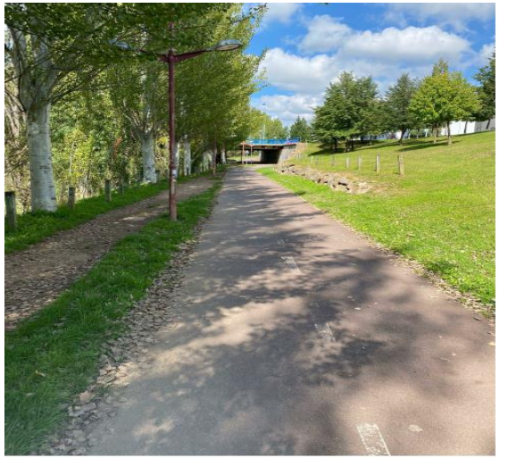
FOTOGRAFÍA 8: CUARTO TRAMO CICLOVÍA, SENTIDO SUR-NORTE