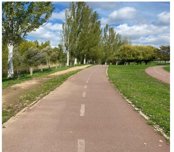
FOTOGRAFÍA 10: SEXTO TRAMO CICLOVÍA, SENTIDO SUR-NORTE