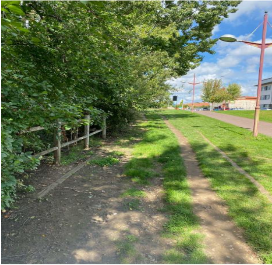
FOTOGRAFÍA 3: SEGUNDO TRAMO SENDA, SENTIDO SUR-NORTE