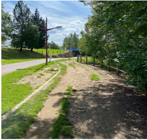
FOTOGRAFÍA 4: TERCER TRAMO SENDA, SENTIDO NORTE-SUR