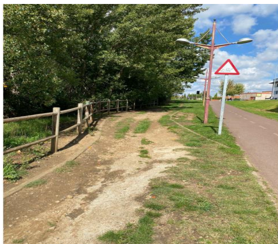
FOTOGRAFÍA 2: PRIMER TRAMO SENDA, SENTIDO SUR-NORTE