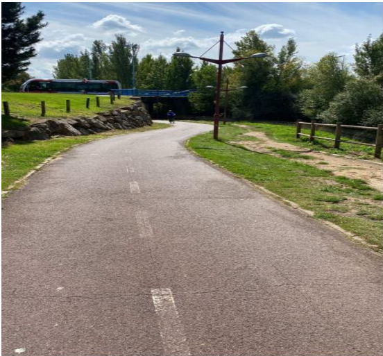
FOTOGRAFÍA 6: SEGUNDO TRAMO CICLOVÍA, SENTIDO NORTE-SUR