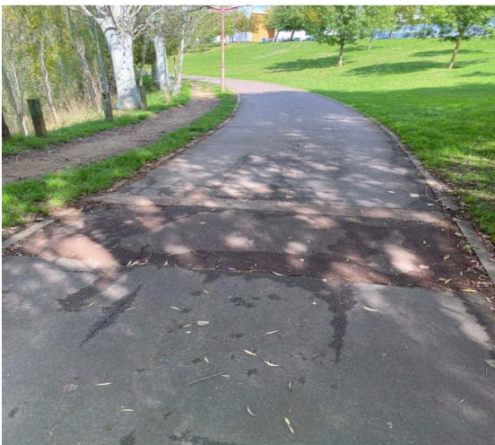
FOTOGRAFÍA 9: QUINTO TRAMO CICLOVÍA, SENTIDO SUR-NORTE