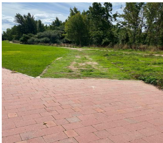
FOTOGRAFÍA 1: INICIO DEL ITINERARIO, SENTIDO NORTE-SUR

Esta situación de inaccesibilidad de la senda peatonal examinada ha sido, efectivamente, confirmada por ese Ayuntamiento. En concreto, en el informe del Servicio de Espacios Verdes facilitado a esta Institución, se señala que este itinerario es deficiente. Así, en aquellas partes que carecen de césped las lluvias y el agua de riego han formado escorrentías que en algunas zonas han lavado la capa superficial. Por tanto, el terrizo no cumple los requisitos para ser considerado accesible en los términos exigidos en la normativa vigente. Las condiciones deficientes de este espacio se pueden observar con claridad en la documentación fotográfica facilitada por esa misma Corporación: