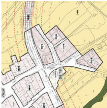
PLANO DE LAS NORMAS URBANÍSTICAS MUNICIPALES

TERCERO. Por el contrario a lo que contemplan los planos catastrales, las Normas Urbanísticas Municipales en vigor, aprobadas en el mes de octubre de 2.016, reflejan esos espacios abiertos dentro del viario de la localidad.